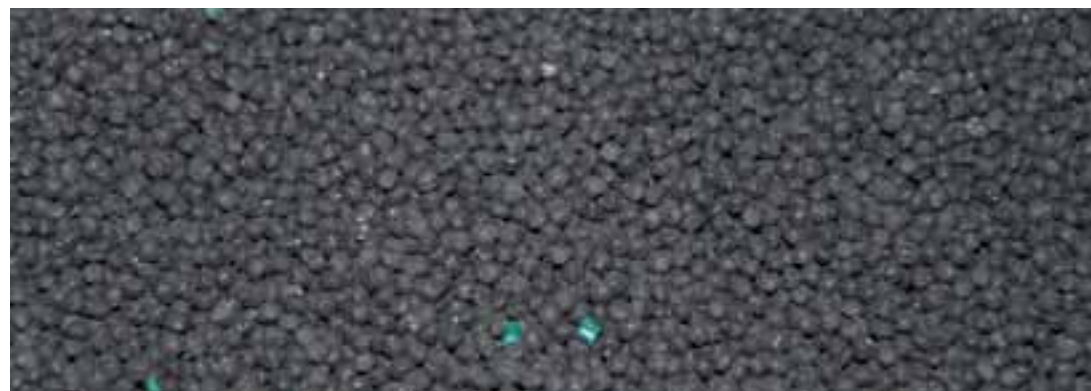
HDPE Kunststoff-Regenerat, wertvoller Produktions-Rohstoff der Universalpalette