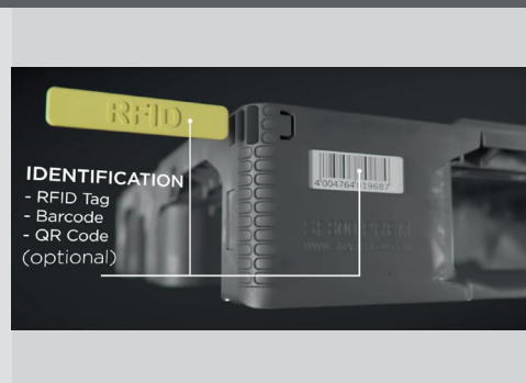
Integration RFID / Labels