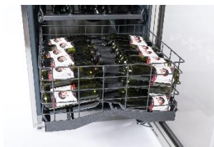
Massenlagerung am Boden